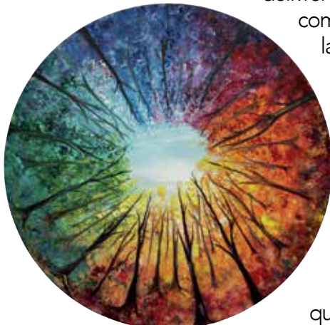
La valse du temps