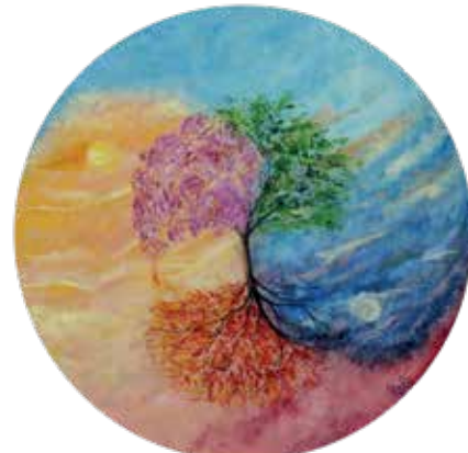
Les quatre saisons

“Peindre, c'est une façon de parler sans mots, d'écrire avec la lumière.” Georges Braque