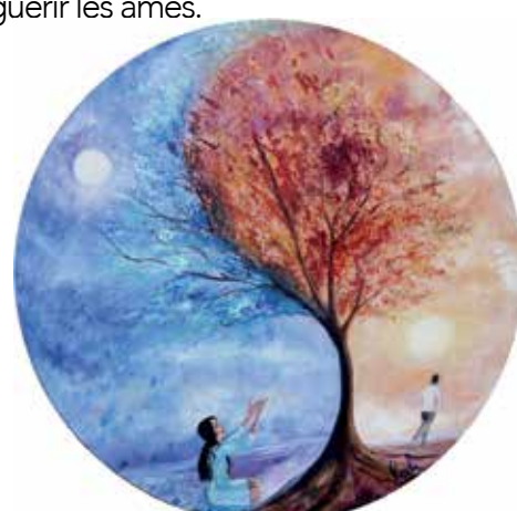
Ne m'abandonne pas